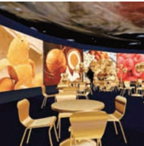
Die Einsatzmöglichkeiten der Duftpräsentation, z. B. in einer Duftlounge, sind vielfältig.